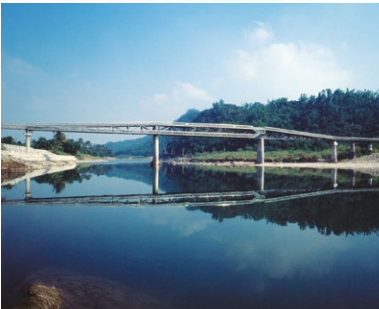
01 地景步道橋利用台糖五分車鐵路橋的橋墩重建，須精算結構安全。