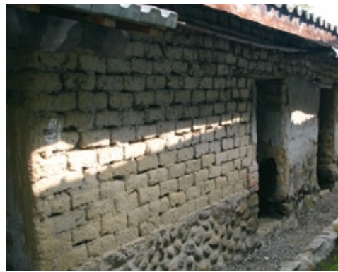
01 土角厝是早年農村的建築，紫雲社區設法保存。