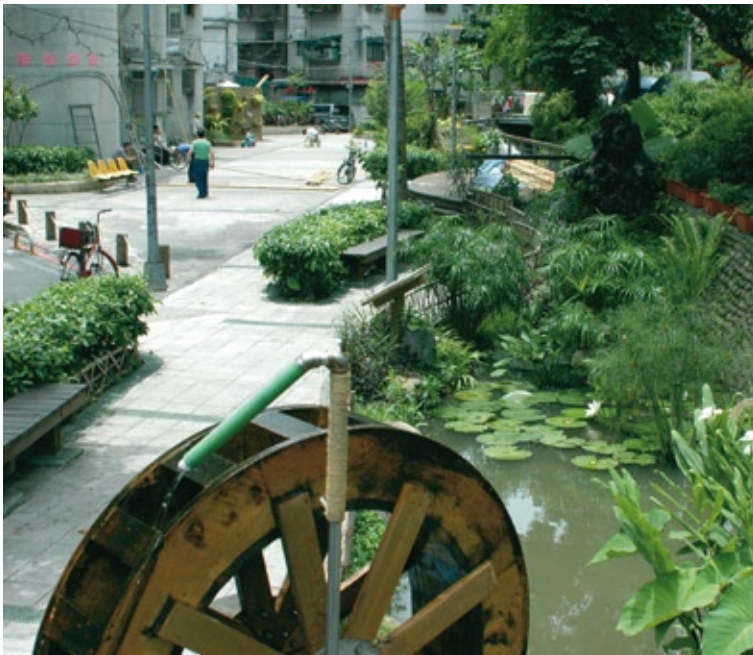
01 將閒置空地改造為水與綠的社區活動空間是惠安社區營造的重點。

透過討論，將社區潛在的水與綠（神大排及綠意盎然的四獸山麓）生態資源與可利用的社區活動場域（溝邊畸零地、公有閒置土地、未開闢公園綠地等）串聯交織，並提出社區安全活動廣場、環境綠美化改善與生態工法的水池設計、雨水回收利用等活化排水溝及社區空間的構想，期望創造出居民及孩童安全舒適的生活與通學通勤廊道及公共空間，營造屬於社區的生機花園，並凝聚原來因排水溝而被分割的社區向心力，喚起在地居民往昔「我家門前有小河」的情境。