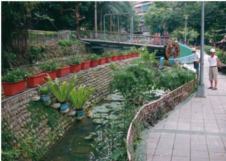
01 社區營造要找回大圳的水岸記憶

現在，整條神大排的違章、私佔停車位與隨意丟棄垃圾的情形已逐漸消失，取而代之的是居民悠閒的步伐、孩子們的歡笑聲，偶而也可見情侶在黃昏時刻駐足談心，「既臭又醜的神大排完全改觀了，它慢慢地把居民的心串在一起！」過去切割惠安里的神大排，如今卻像條拉鍊般，把整個惠安里緊緊地串連起來。