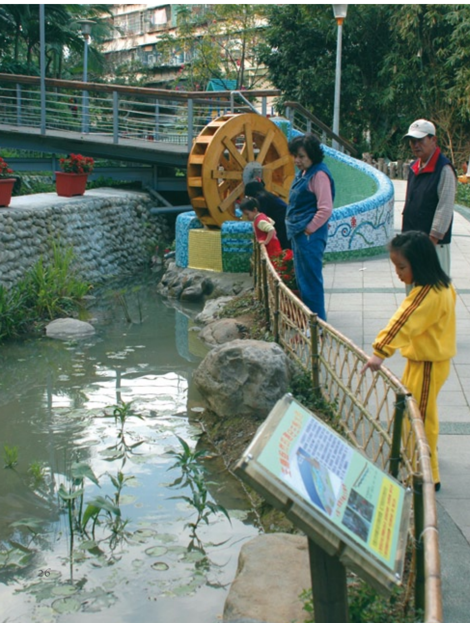
01 惠安社區成功利用「水」的元素，讓社區居民注意家園的美麗變化。